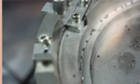
入料 (振動盤或料管) Bowl/Tube Feeder