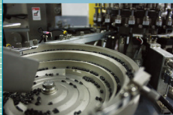
■ 入料Bowl feeder