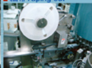
■ 編帶Taping out