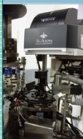
■ 雷射刻印, 刻印檢查 Laser Marking, Marking inspection